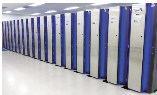
図2 演算ノードのラック（一部） 写っているラックには大規模演算向けのノード（合計約800台）が搭載されています。